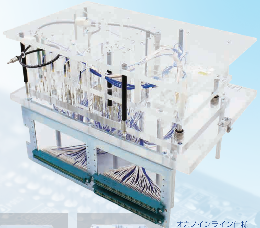
オカノインライン仕様