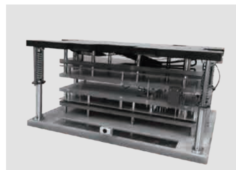
専用インライン低高温装置向け治具

接触抵抗を最小限に抑え、シリンダーを用いて駆動させ必要なポイントに接触させる可動機構がついた治具